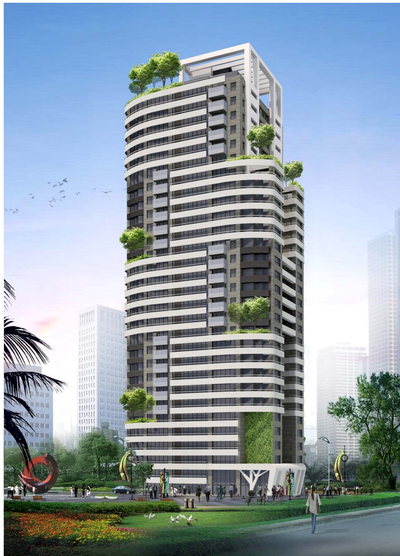
圖 12-5 建築物透視模擬圖