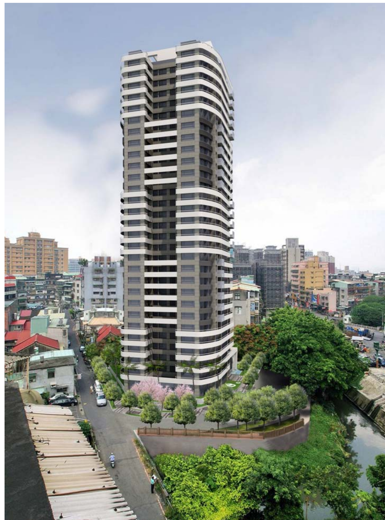
圖 12-6 建築物日間環境模擬圖